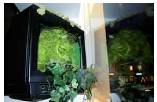
Vitrine (voir page 10): The 48 hours film project, septembre 2008 Festival électron, mars 2008 (avec détail à droite))