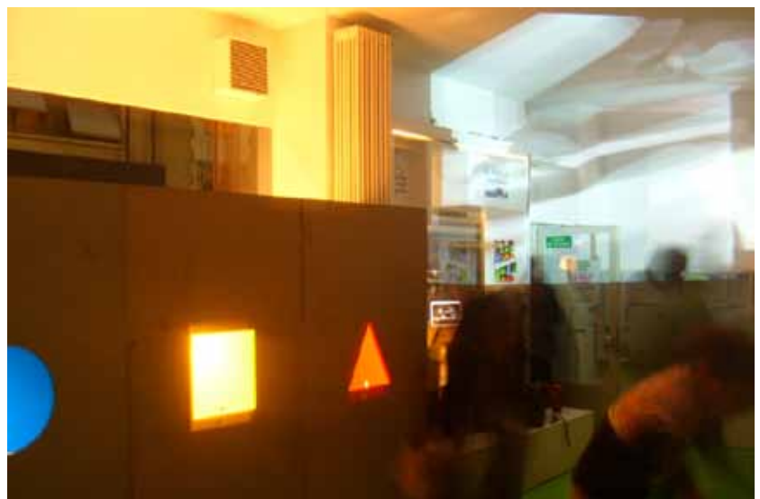
Fête du 25 septembre 2008 (voir page 10)

(*) Remarque: chaque client peut être inscrit dans plusieurs domaines d'activités différents